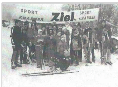
Stadtmeisterschaft 1983 Tettau

... am Sonntag, dem 25. Februar 2024 zur Stadtmeisterschaft im Abfahrtslauf ... ... auf der Wildbergabfahrt in Tettau!