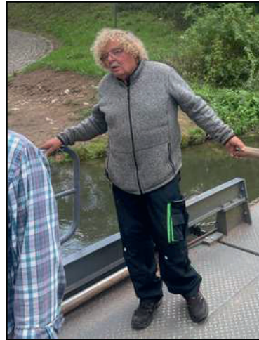
Reinhold - eine lebende Legende!

Weiter führte die Tour über Erlach nach Schlüsselau. Die dortige Klosterkirche bot Anlaß zu einer Unterbrechung mit Besuch auf die im Außenbereich vermutete Grablege des berühmtesten und letzten Schlüsselbergers Konrad II.