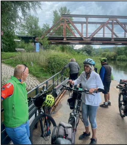
Hinter der Fähre eine ICE-Brücke?