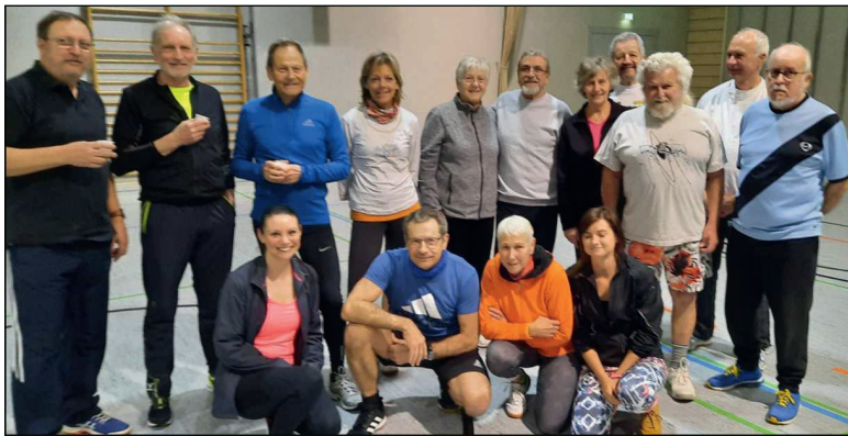
Unsere Gymnastikgruppe im Januar